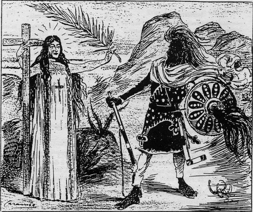
II. — MONOVERBO-INCASTRO di Aldo Arnoldi.