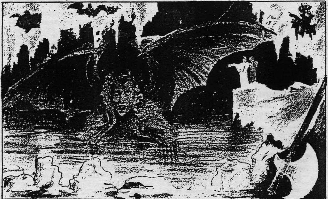
VII. — MONOVERBO-ALTERNO (..X X X..X X) di Ailo Arnoldi .