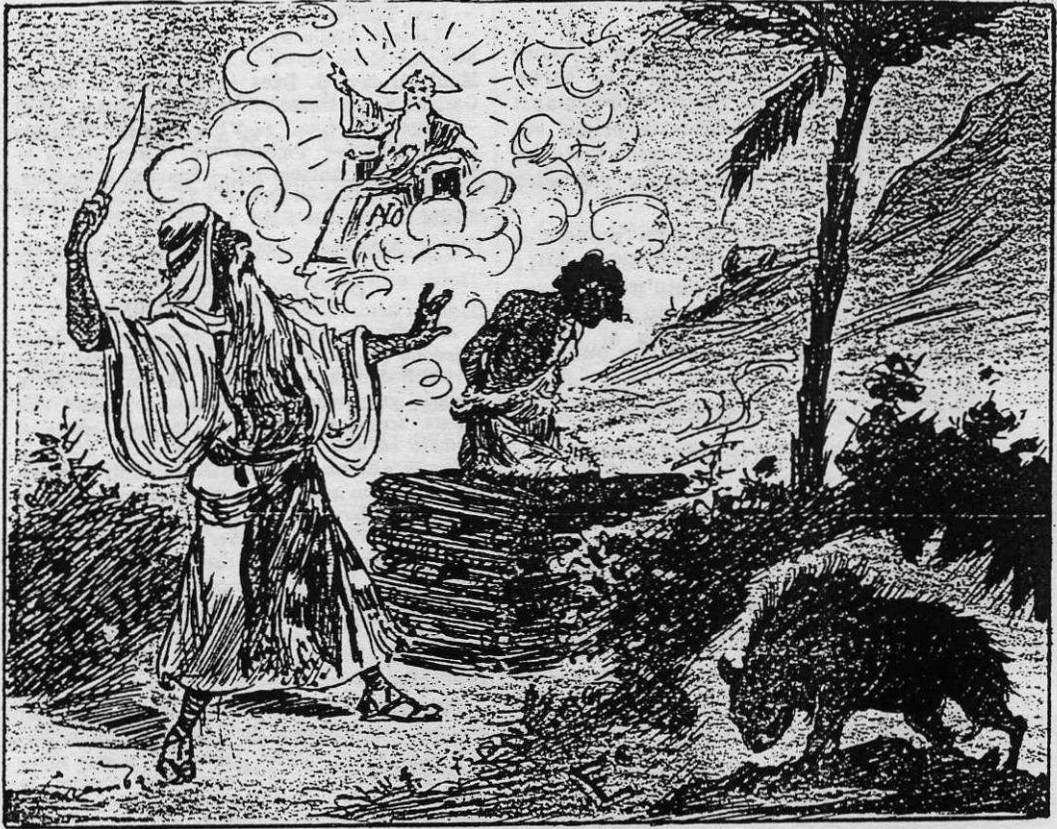
VI. — REBUS del Bearnese .