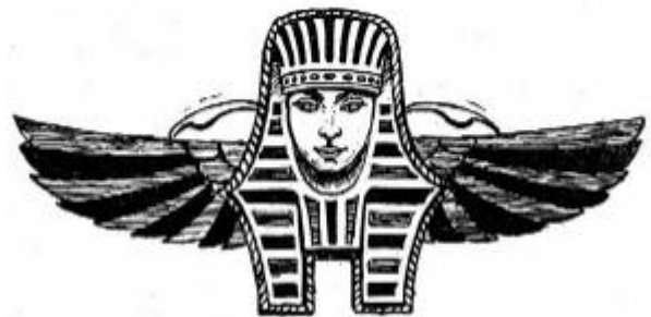
IL DISTINTIVO DELLA S.F.I.N.G.E.

La S.F.I.N.G.E. vivacchiò ancora per alcuni anni, fra polemiche e discussioni risibili per l'utilizzazione dei fondi rimasti; con l'avvicinarsi della guerra non se ne parlò più.